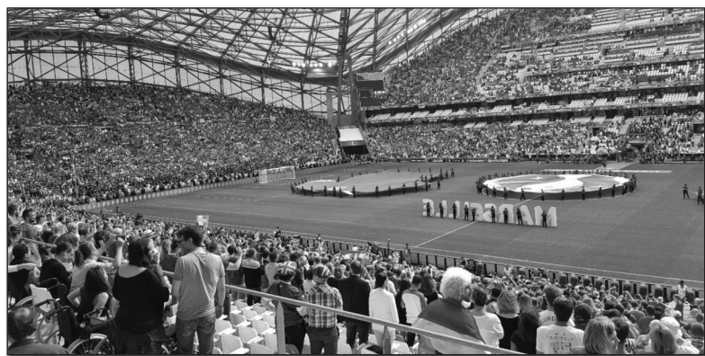
30 ezer magyar szurkoló a Stade Velodrome-ban, Izland ellen (Marseilles)

Nos, ha ilyen szemüvegen keresztül kezdjük el nézni a világot, s benne hazánk teljesítményét, egészen más megvilágításba kerül a magyarok és akár a mi, személyes életünk is. Valószínűleg kevesebbet panaszkodnánk, ha örülni tudnánk az apróbb si-