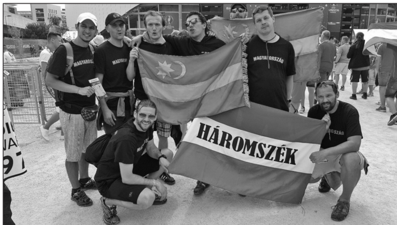
A magyarok összefogása nem ismer határokat. Székely testvéreinkkel Marseilles-ben

egészségesebb egy nemzet lelkiállapota, annál kisebb az egészségügyi ellátásra szorulóak száma. Kevesebb a depresszió, a lelki okokra visszavezethető szervi megbetegedés.