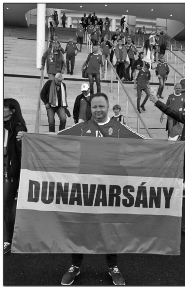
Bordeaux-ban is varsányiként

Ez volt a benyomásom akkor is, amikor Bordeaux utcáin az ellenfél, Ausztria szurkolóival fényképeztünk, amikor a mérkőzésre vezető úton együtt énekeltünk, s amikor a stadion bejáratánál velük táncoltunk, mulattunk perceként át. A vizsálynak és az ellenségeskedésnek nyoma sem volt, pedig egy órával később harcokként „estek egymásnak” a két válogatott labdarúgói a Matmut Atlantique-ban. Az eredmény ismert, Magyarország nemzeti válogatottja történelmi, 2:0-ás győzelmet aratott az osztrákok felett. A mérkőzés után nem csak Bordeaux közterei, de Budapest körútjai is megteltek ünneplő magyar tömegekkel. Örömmámorban úszott az egész ország. Ahogy másfél hónappal később Szász Emese vagy Hosszú Katinkai olimpiai aranyérmei után... Utóbbiaknál talán csak azért