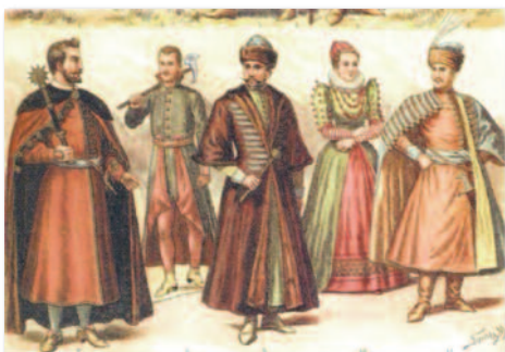
Erdélyi magyar nemesi viselet a 16. század végén, 17. század elején