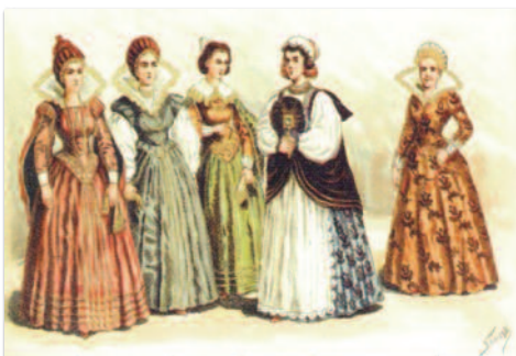
Erdélyi nemesi viseletek a 17. század második feléből

A Magyar Cserkészszövetség ICHTHÜSZ Közösségének folyóirata (ISSN 1219-6479)