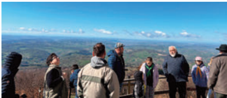
A Bekecs tetőn

Gasztronómiai élményünk is akadt erre a napra. A közelben lévő pisztrángos tavak melletti étteremben – ki rántva, ki rostos – próbáltuk ki a helyi halat. Nem csalódtunk.