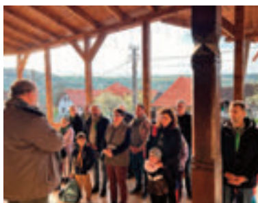
Reggeli áhítat a Faluháznál