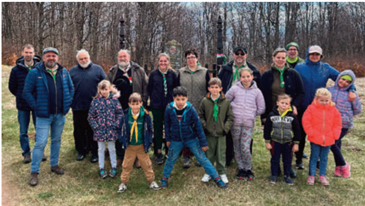
Együtt tisztelegtünk a II. világháború áldozatai előtt