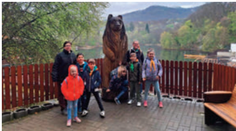
Medvével a Medve tónál

A hosszú odautat megszakítottuk egy dévai pihenővel, amely a nehézségek ellenére lelkiileg megalapozta a következő időszakot. Mire a nyújtózkodás után felvérteztük magunkat, hogy megmásszuk a dévai várdombját, eleredt az eső: egész pontosan Déván dézsából öntötték. Ez a tény azonban nem szegte kedvünket, néhányan lemorzsolódtak ugyan, de végül csak felmentünk, legalább a várfalakig. A kilátás élménye kárpótolt mindenkit. Nem csak a várost, de a környező hegyek magas csúcsait is láthattuk. Estére érkezünk meg Nyárádselyére, ahol a helyi ismeretekkel