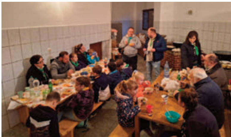
Az étvágyunk nem romlott

Másnap aztán autóba ültünk újra, hogy a környék nevezetességeit sorra vegyük. A szűkös idő és sok látnivaló metszetébe Szováta, Parajd, Farkaslaka, Székelyudvarhely, és az utóbbi településtől pár km-re működő Legendárium, más néven Mini Erdély is belefért. Szováta körülbesétálva a tavat rácsodálkoztunk az alpesi, síparadicsomi hangulatra.