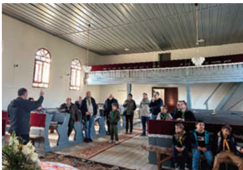
Persze a református templombelsőt is megcsodáltuk

Megható és felemelő volt a pillanat, amelyben az anyaországiai szinte tátott szájjal hallgatták, ahogyan a két kamasz és szüleik hegedűkísérettel nótáztak. Még a kicsik is szinte mozdulatlanul füleltek, mintha értették volna azokat a fontos üzeneteket, melyek a helyiek ajkáról zengtek: