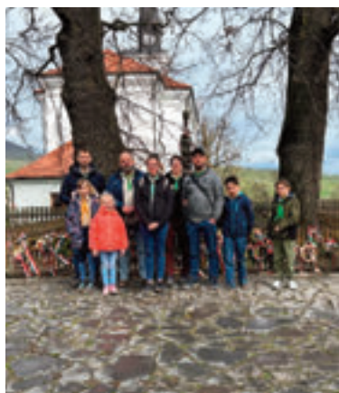
Tamási Áron sírjánál