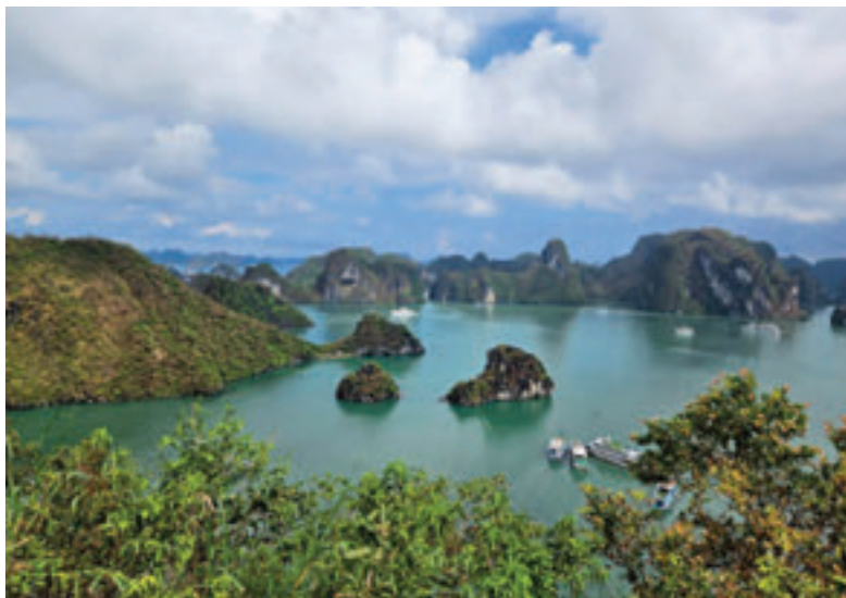
A Ha Long-öbölben álló mészkősziklák 1994 óta az UNESCO világörökség részét képezik

A teremtett világ szépségei mellett az ember alkotta főváros, Hanoi okozta a legnagyobb meglepetést. Valóságos kultúr-sokk, amit egy Európából érkező turista ott átél. A közel nyolcmillió lakos föld alatti és föld feletti tömegközlekedés nélkül oldja meg a helyváltoztatást a város egyik pontjából a másikba. A metró, villamost és buszt itt robogók pótolják, 5 milliónál is több regisztrált motorkerékpár szeli az utakat. Ritka, hogy egyiken másikon ne egy 3 vagy 4 fős család utazzon, és a lábak között olykor még egy kutya is elfér.