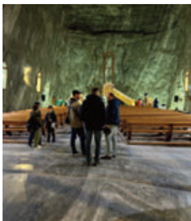
A sóbánya kápolnájában

Az élményekben gazdag nap végén jól esett a krumplis slambuc, amelyre se a krumplisztésza, se a klasszikus slambuc kifejezés nem volt érvényes. Ez persze nem kisebbítette, inkább gazdagította az ízvilágot. Cserkészszokás szerint ugyanis a slambucba belekerült a szalonnán kívül a maradék kolbász és sonka is.