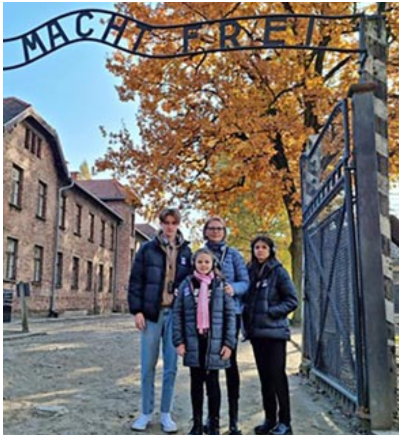
Auschwitz I. bejárata, a „munka szabaddá tesz” cinikus felirat egy részletével

Az egykori lengyel főváros testvéri légkörét magunk mögött hagyva, harmadnap Oswiecim, ismertebb nevén Auschwitz felé vettük az irányt, hogy a történelemkönyvekből, filmekből, elbeszélésekből ismert borzalmak helyszínét élőben is megismerjük.