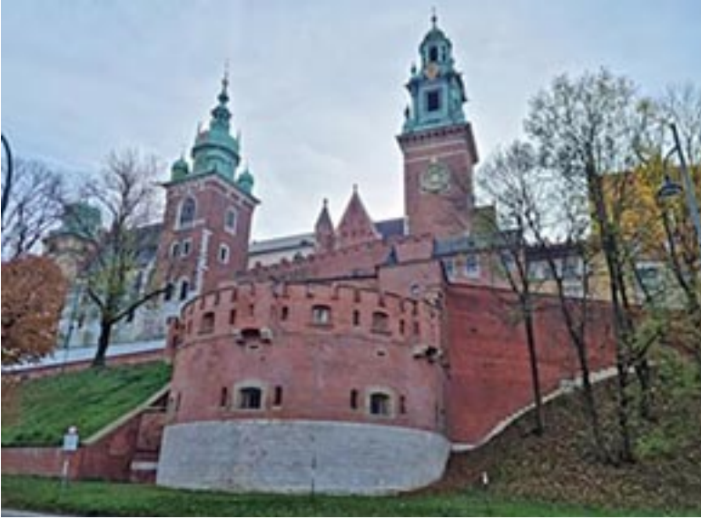
A waweli domb, rajta a székesegyház

A sors úgy hozta, hogy az iskolai őszi szünetet Lengyelországban töltöttem családi kirándulás keretében. Első utunk Krakkóba vezetett, ami az októberi, sárguló falevelek díszletében festői látványt nyújtott. A waweli dombon fekvő székesegyház minden odalátogató magyar számára kötelező látnivaló, a lengyel-magyar uralkodók mellett Báthory István erdélyi fejedelem sírmeleke is megtalálható itt. A „Lengyel, magyar – két jó barát” ismert közmondás is a két nép közös történelmére utal, ami a székesegyházban állva kézzel fogható valósággá elevenedik.