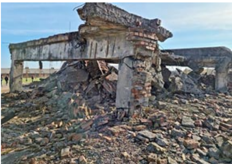
Egy felrobbantott gázkamra romjai Auschwitz-Birkenauban

elő hasonló. „Hitlerék, Sztálinok, Napóleonok” ugyanis minden korban születnek, a többségi társadalom lelkületén és értékítéletén múlik, ki tudnak-e teljesedni, vagy nézetükkel számkivetett, elszigetelt emberökké válnak. Hiszem azt, hogy ha gyermekeink helyes nevelést kapnak szüleiktől, egészséges én- és társadalomképpel rendelkező felnőttekké lesznek, akik már csak a történelemkönyvek oldalairól hallanak a holokausztról. Ezért hát mondd el Te is faidnak!