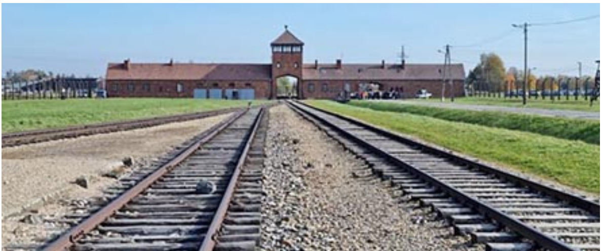
Auschwitz II. (Birkenau)

Apaként különös felelősséget érzek azért, hogy gyermekeimmel megismertessem a XX. század rémtetteit és átérezzék az emberi kegyetlenséget, hogy újra, még egyszer ne fordulhasson