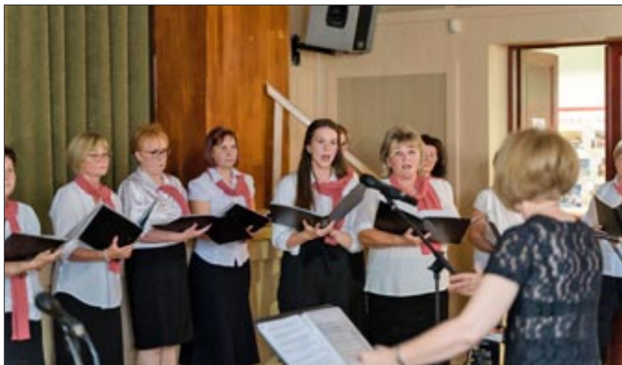
A Mollissima Női Kar 20 éves jubileumi koncertje

Azzal a reménységgel viszont vigasztalom magam, hogy hátha