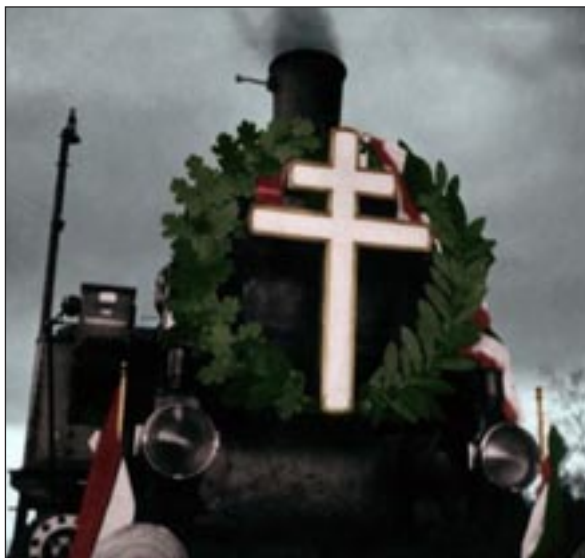
A világító kereszt a mozdony elején

Bátran állíthatjuk, hogy az ereklyét szállító vagon, az „aranykocsi” a magyar tervező- és díszítőművészet remeke volt! Az aranyvonat egy mozdonyból és öt kocsiból állt. Az egyházi és világi méltóságokat szállító két-két luxuskocsi fogta közre az ereklyét szállító, bizánci stílusban díszített „aranykocsit”.