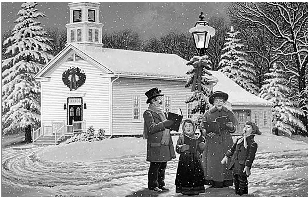
John Sloane, amerikai festőművész karácsonyi képe

ÁLDOTT, BÉKÉS, SZERETETBEN GAZDAG KARÁCSONYT KÍVÁNUNK!