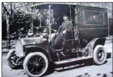
A Csonka-féle postaautó 1905-ből