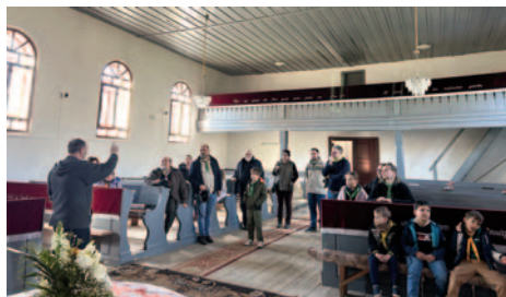
A nyáradselyei templomban