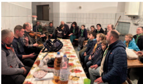
Autentikus nótákat tanultunk autentikus helyi énekesektől

főként egy monumentális új katolikus templomból áll, megtekintettük a Keresztutat. Tovább haladva megnéztük a „Hős bajtársaink!” emlékhelyét, innen pedig – egy kis tévedéses kerülővel – az ebédünket is biztosító pizstrángos tóhoz. Persze az ebédhez szükség volt egy kellemes étteremre is, de a pizstrángos „farm” munkájába való betekintés is sokunknak adott új élményt és ismeretet. Ja, hogy el ne felejtsem a szemfülesek „tévútjukon” még medvéket is láttak. Visszaérve táborunkba fakultatíve választhattunk programot. A csapattal, akikkel én voltam, visszamentünk a Bekecs-hegy egyik pontjára, ahol csodás kilátás volt, nem tudtunk betelni vele. A hegyeken, dombokon fel le szaladgálás, gurulás mellett sor került egy focimeccsre is. Vacsora és áhítat után elvonult mindenki a saját „körletébe”.