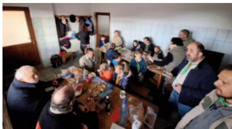
Még természetesebben reggelivel