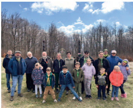
Tisztelgünk a Nyárádselye dombjainál elesett hősök előtt

Útközben megálltunk felfedezni Déva várát, ami kalandosra fordult, mert egyrészt nem működött a felvonó, másrészt zuhogott az eső. Természetesen bennünket egyik sem állított meg, felmentünk megcsodálni a várat és a gyönyörű kilátást. Szálláshelyünk négy-felé szakított bennünket, de közösen étkeztünk és a lelki feltöltődéseken is együtt vettünk részt. A szinte hallható csend és a jó erdélyi levegő pihentető éjszakát biztosított mind-annyiunknak.