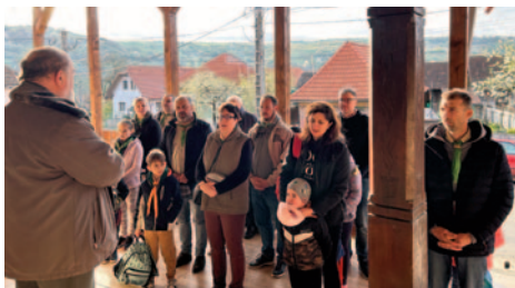
Természetesen reggeli áhítattal kezdtük a napot