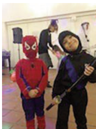
A legharciasabb hódok

Elvis él?! A felvonuló izgalmas jelmezesek seregszemléje