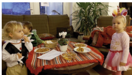
A törp-egyszarvú-aligátor pihenése finom falatok mellett