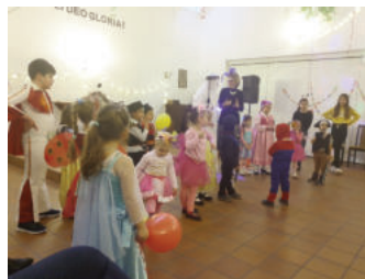
Pókember továbbra sem fedi fel magát...