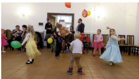
Szerintem a jégkirálynő szoknyája pörög a legszebben! Szerinted?