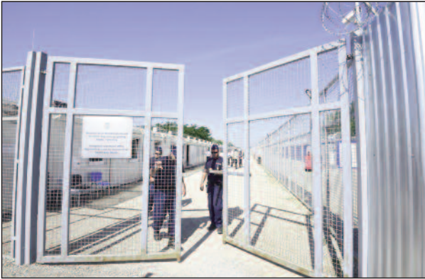
Tranzit zóna bejárat, ahova járunk prédikálni.

Szinte kételkedve olvassuk Jézusnak ezeket a szavait. Hogyan tehetnénk mi nagyobbakat Nála? És mégis, már az első Pünkösdkor a tanítványok olyan ajándékot kaptak, amit Jézus sem tett: nemzetközi többnyelvű hallgatóság értette a prédikációt. Nem a tanítványok nagysága, hanem a Szentlelket ajándékozó Atya jóvoltából következett ez be. Hiszem, hinnünk kell, hogy ha kérjük Isten Szentlelkét, akkor nemcsak kapjuk, hanem valamiféleképpen Jézus megdicsőíti magát bennünk, és megtehetünk olyat, amit még Ő sem tett földi szolgálata alatt. Engedj Jézus bátorításának, kérd a Szentlelket, és használj vele! „Ha tehát ti gonosz létekre tudtok gyermekeiteknek jó ajándékokat adni, mennyivel inkább ad mennyei Atyátok Szentlelket azoknak, akik kérik tőle?” (Lk. 11,13)