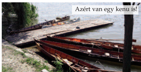
Azért van egy kenu is!