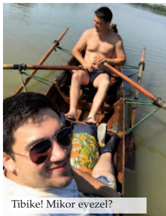
Tibike! Mikor evezel?