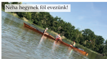
Néha hegynek föl evezünk!