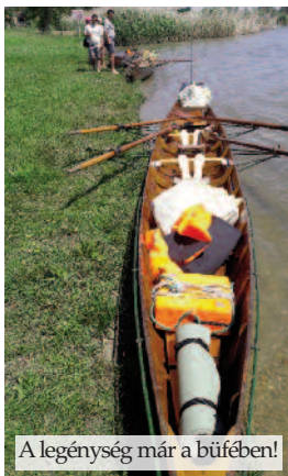
A legénység már a büfében!